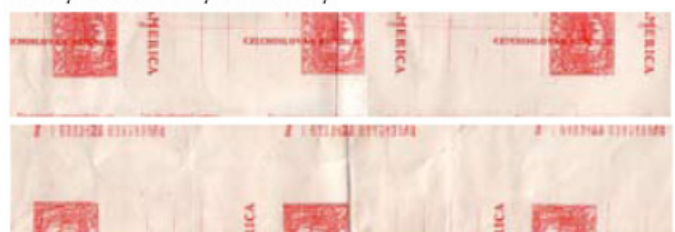
Jsou také známy svíslé pruhy šíře asi 30mm na výšku osmi celin (72cm) s oboustranným tiskem, které byly zřejmě vyříznuty z makulatury (vyobrazeny pouze části pruhů).

Z průběhu tisku „Hutchinsonových“ dopisnic nejsou doposud známy nekvalitně vytištěné kusy.